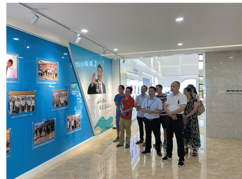
运营厂公众开放活动