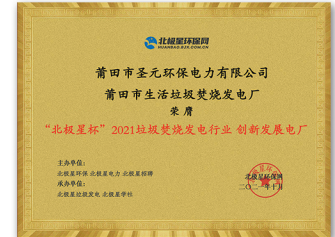
2021北极星杯·创新发展电厂