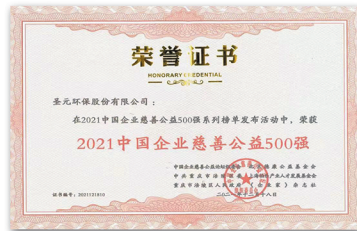
2021中国企业慈善公益500强