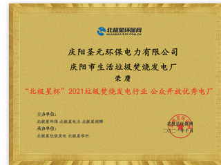
2021北极星杯·公众开放优秀电厂