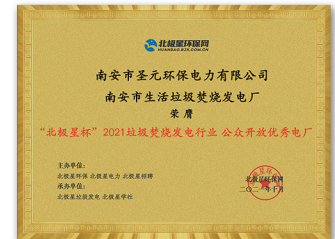
2021北极星杯·公众开放优秀电厂