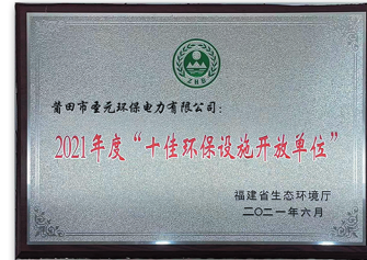
2021十佳环保设施开放单位