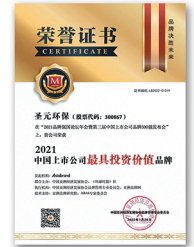
上市公司最具投资价值品牌