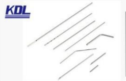
特殊针管 Special Needle Tube