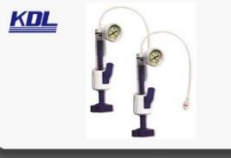
按压式球囊扩张 压力泵 Inflation Device