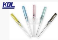
笔杆型留置针 Pen type I.V. Catheter