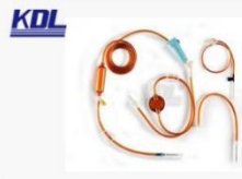
蔽紫外光输液器 Opaque Infusion Sets