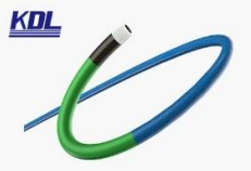
指引导管 Guiding Catheter