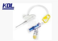
留置针 (正压) Positive pressure I.V. Catheter