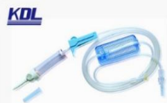
精密过滤输液器 Infusion Sets (Precise Filter)