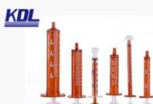
喂药器 Oral Syringe