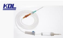
输液器(TPE材料) Infusion Sets of TPE Material