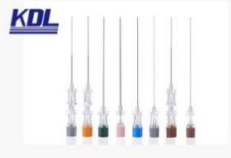
麻醉针 Neuriaxial Needle