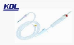
输血器 Transfusion Sets