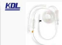
输液器(TOTM材料) Infusion Sets of TOTM Material