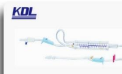
吊瓶式输液器 Infusion Sets with Burette