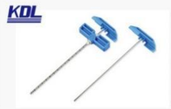
骨髓穿刺针 Bone Marrow Transplants Needle