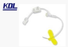
植入式给药装置 专用针 Special Injection Needle