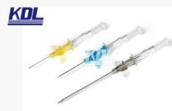
蝶翼型留置针 Wing Type IV. Catheter