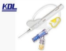
安全正压留置针 Safety Positive Pressure IV. Catheter