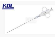
活检针 Biopsy needle