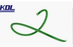
微导管 Micro Catheter