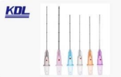
填充注射针 Filling injection needle