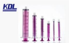
喂食器 Enteral Syringe