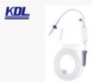
输液器 Infusion Sets