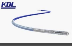
指引导丝 Cardiovascular Guidewire