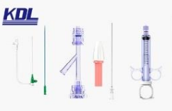
介入手术器械包 Intervention Accessories Kit