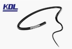
血管内微导丝 Micro Guidewire