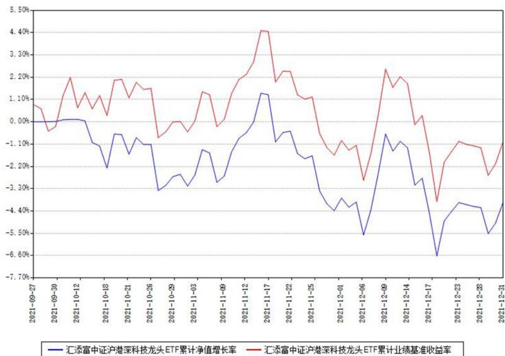
汇添富中证沪港深科技龙头ETF累计净值增长率与同期业绩基准收益率对比图