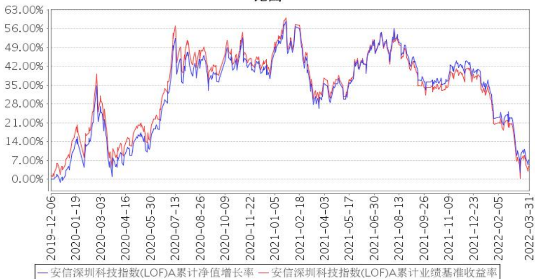
安信深圳科技指数(LOF)A累计净值增长率与同期业绩比较基准收益率的历史走势对比图