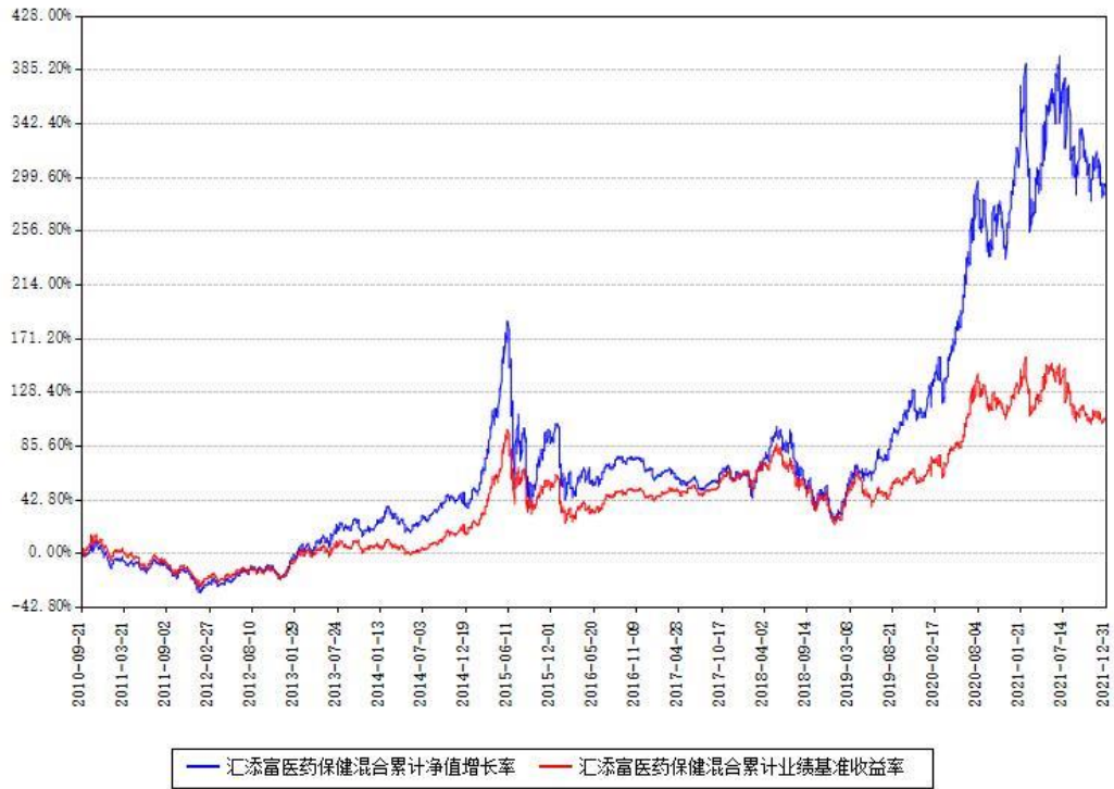
汇添富医药保健混合累计净值增长率与同期业绩基准收益率对比图