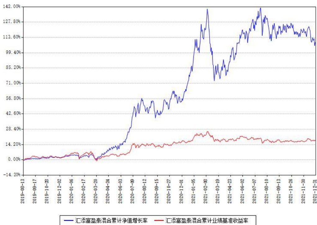
汇添富盈泰混合累计净值增长率与同期业绩基准收益率对比图

(二) 自基金合同生效以来基金累计净值增长率变动及其与同期业绩比较基准收益率变动的比较图