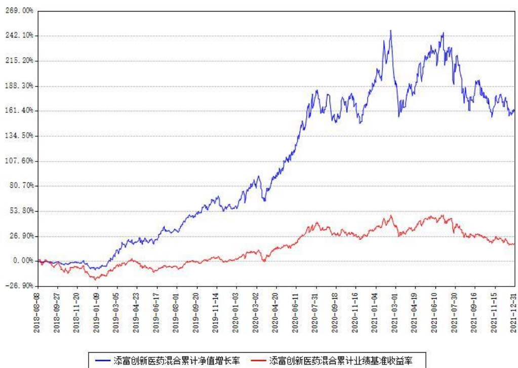
添富创新医药混合累计净值增长率与同期业绩基准收益率对比图