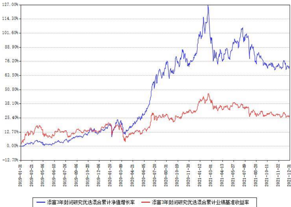
添富3年封闭研究优选混合累计净值增长率与同期业绩基准收益率对比图

注：汇添富 3 年封闭运作研究优选灵活配置混合型证券投资基金自 2022 年 2 月 7 日起转为开放式运作，基金名称变更为“汇添富研究优选灵活配置混合型证券投资基金”。上述图表为本次转型前的业绩数据。