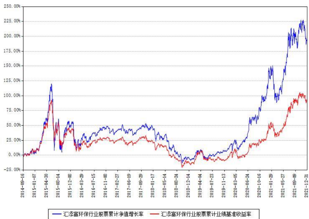
汇添富环保行业股票累计净值增长率与同期业绩基准收益率对比图