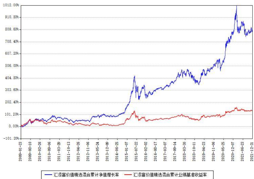
汇添富价值精选混合累计净值增长率与同期业绩基准收益率对比图