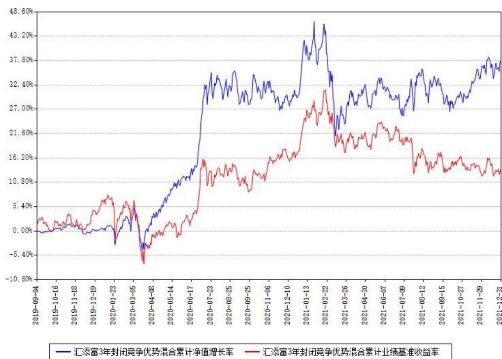
汇添富3年封闭竞争优势混合累计净值增长率与同期业绩基准收益率对比图

(二) 自基金合同生效以来基金累计净值增长率变动及其与同期业绩比较基准收益率变动的比较图