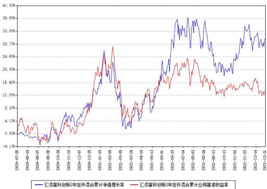
汇添富科创板2年定开混合累计净值增长率与同期业绩基准收益率对比图