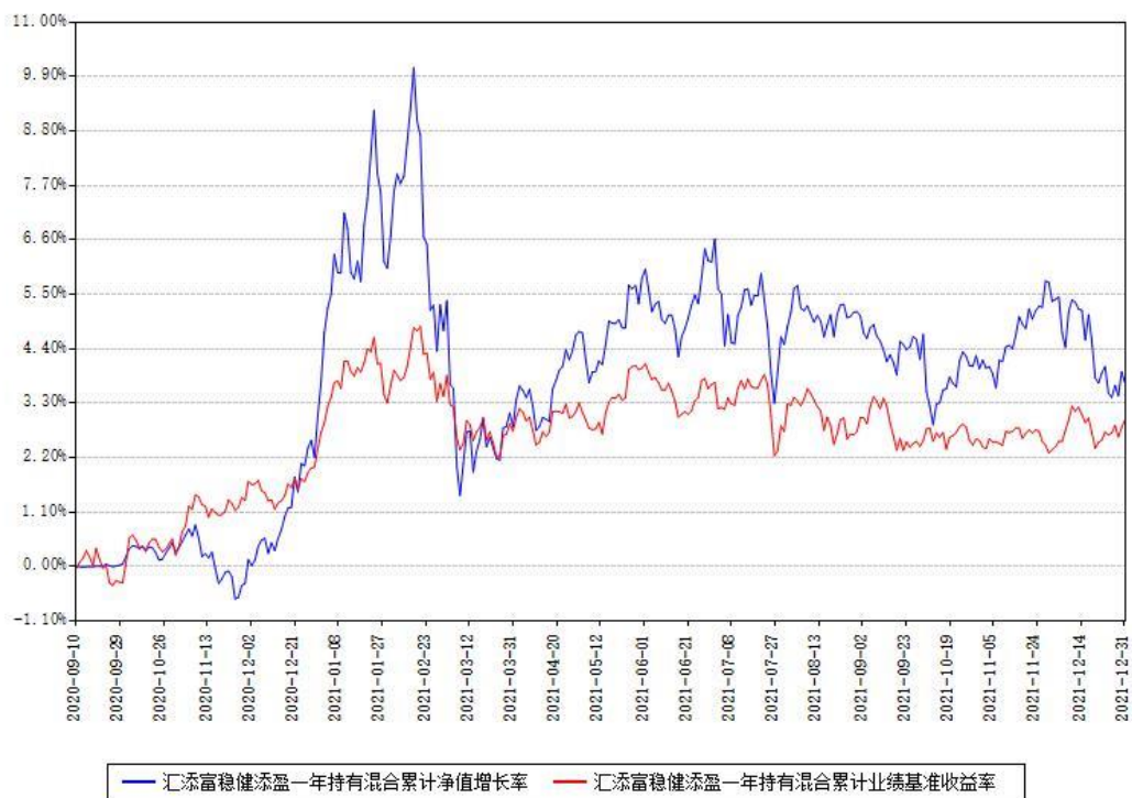
汇添富稳健添盈一年持有混合累计净值增长率与同期业绩基准收益率对比图