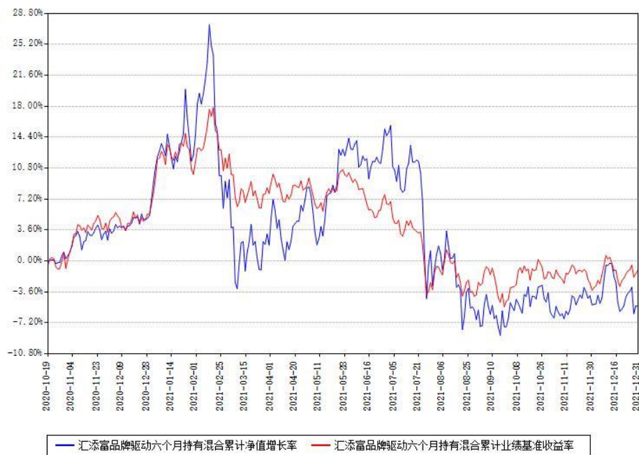
汇添富品牌驱动六个月持有混合累计净值增长率与同期业绩基准收益率对比图