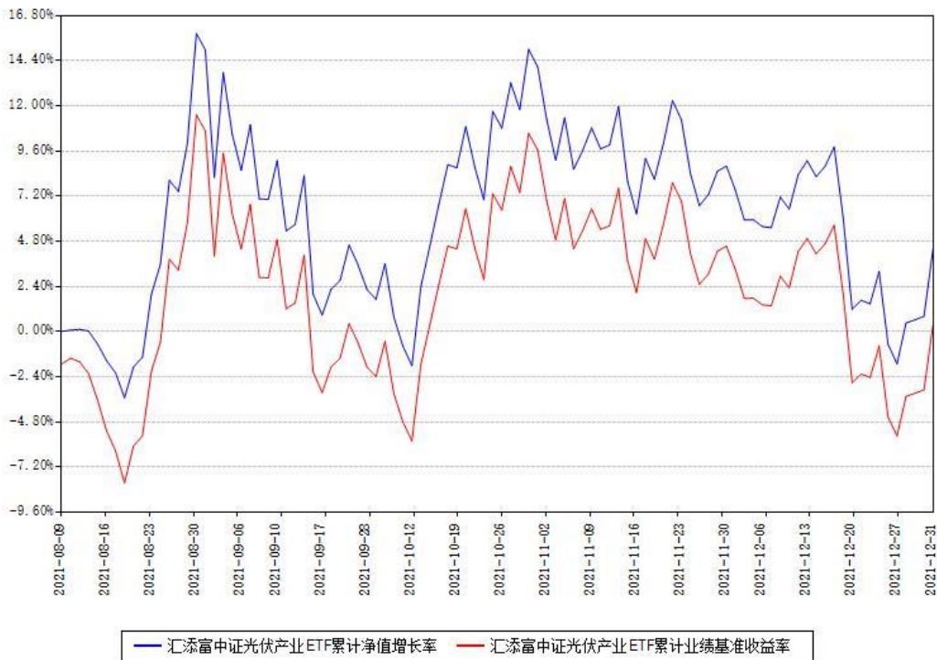
汇添富中证光伏产业ETF累计净值增长率与同期业绩基准收益率对比图

(二) 自基金合同生效以来基金累计净值增长率变动及其与同期业绩比较基准收益率变动的比较图