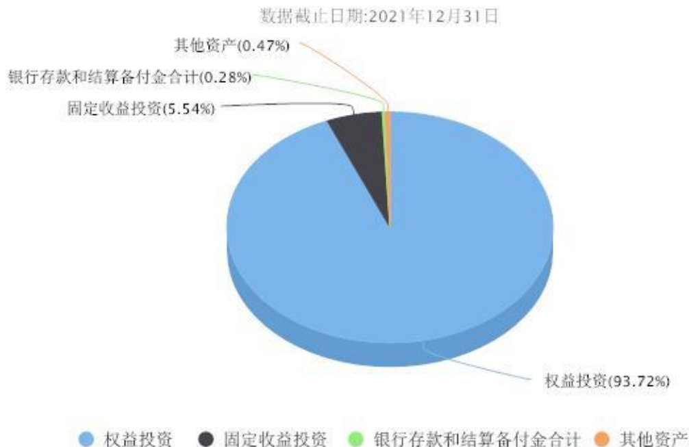
汇添富品牌驱动六个月持有混合投资组合资产配置图表