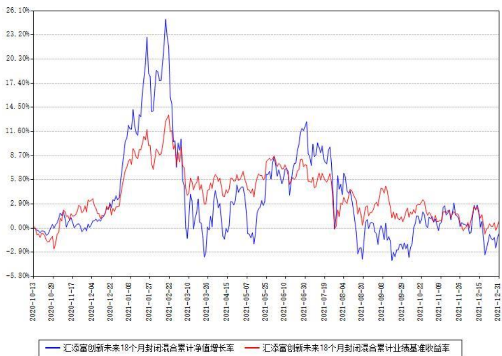
汇添富创新未来18个月封闭混合累计净值增长率与同期业绩基准收益率对比图