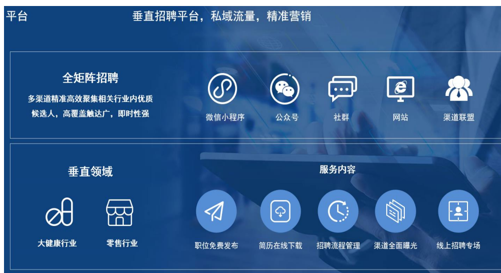
图2：人力资源管理SaaS平台