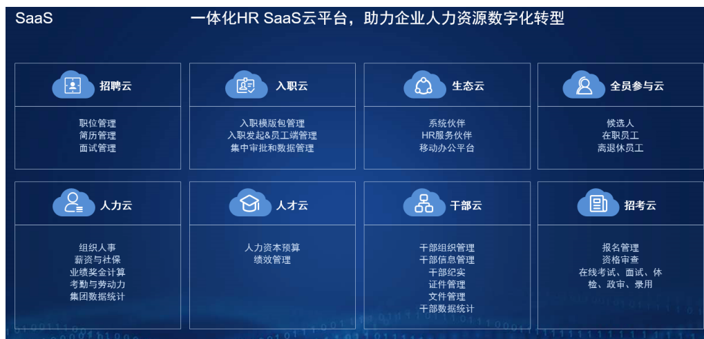
图3：人力资源产业互联平台