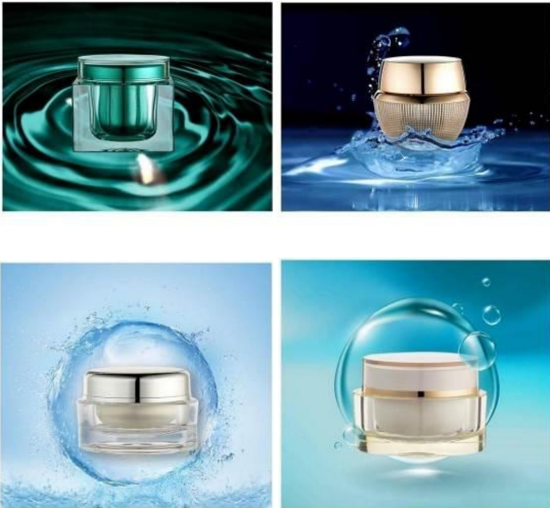
膏霜瓶系列产品示意图

膏霜瓶系列产品具有广口特性，使用时通过打开瓶盖将其中的化妆品取出使用，膏霜瓶具有结构简单且灌装方便等特点，对于粘度相对较大的化妆品是很好的包装容器选择。