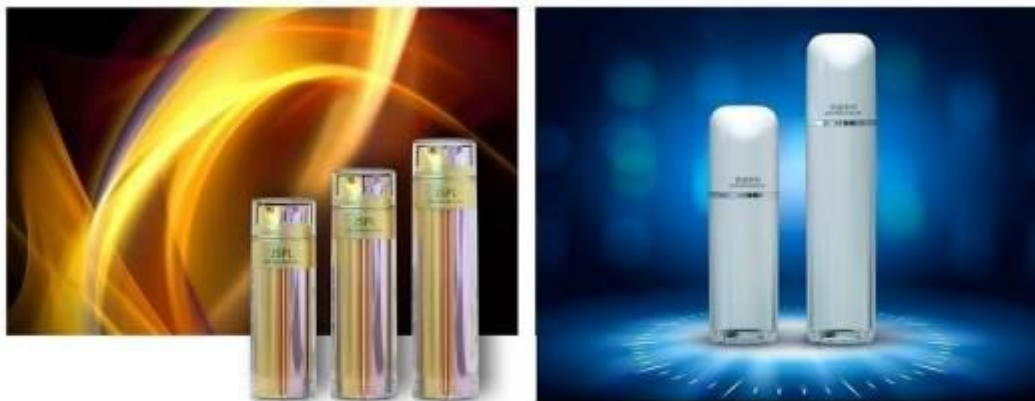
乳液瓶系列产品示意图