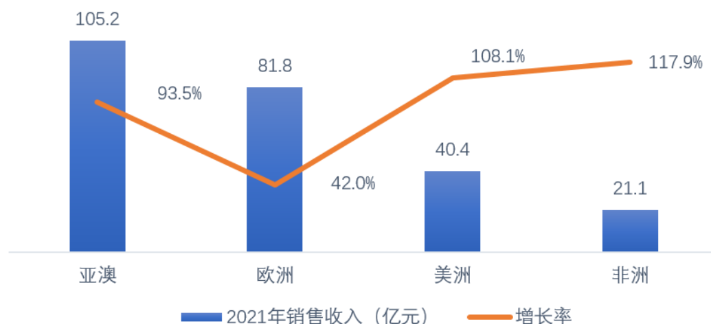
海外各区域销售情况

亚澳区域 105.2 亿元，增长 93.5%；欧洲区域 81.8 亿元，增长 42%；美洲区域 40.4 亿元，增长 108.1%；非洲区域 21.1 亿元，增长 118%；50 多个国家实现翻番增长。