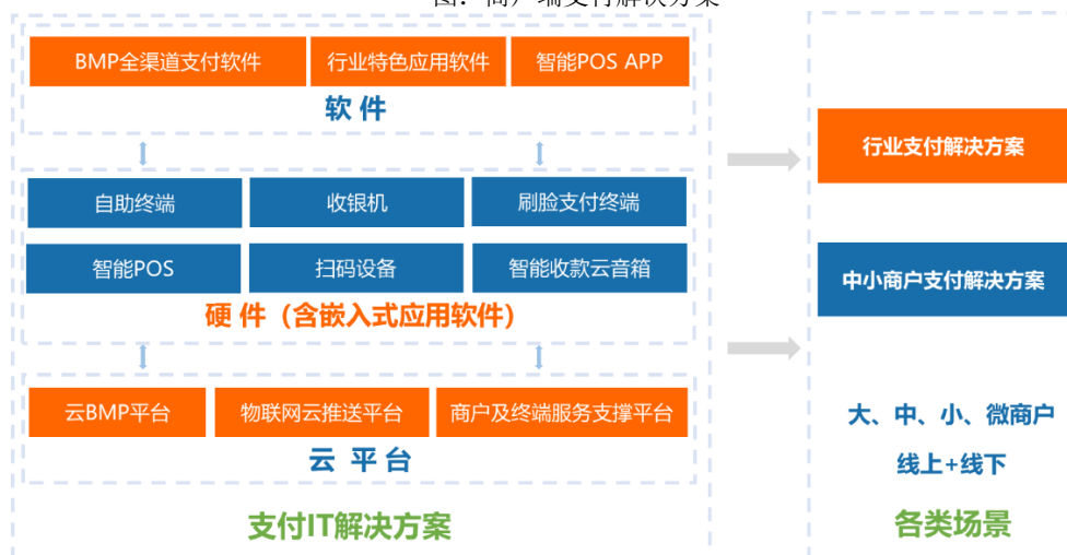
图：商户端支付解决方案

按照服务模式不同，商户规模大小，方案的个性化程度，技术实现难易程度，商户端支付解决方案分为行业支付解决方案及中小商户支付解决方案。