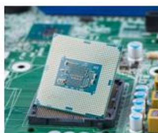
IC 封装基板 (芯片)