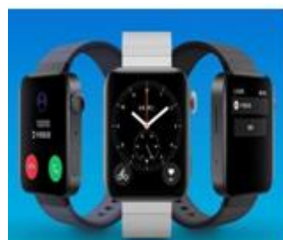
可穿戴智能电子产品