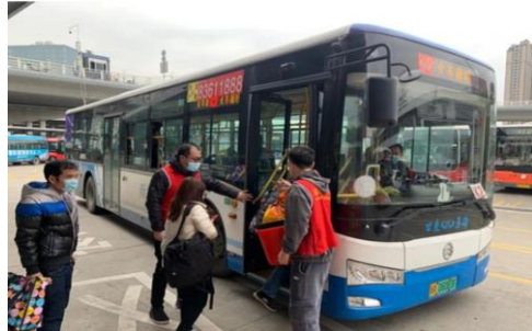
志愿者引导乘客坐车

公司联合福州市公交集团党委前往火车站北广场开展以“争当志愿者 温暖在榕城”为主题的志愿服务活动。志愿者们贴心的准备了口罩、洗手液等防疫物品，并为那些没有移动支付的乘客提供了零钱兑换，充分践行“学习雷锋、帮助他人、提升自己”的志愿服务理念。