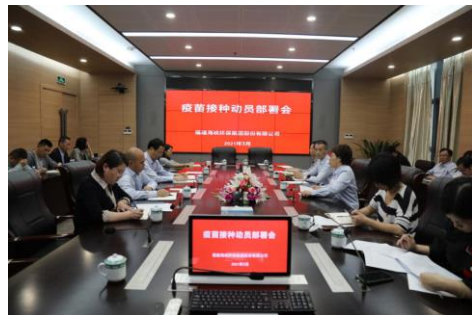
召开疫情专题会议

报告期内，公司全体上下一心，全力推动疫情防控常态化工作，持续做好“一看一测一登记”、查验三码、扫描张贴码、来访人员审批、生产办公场所消杀等人物环境同防工作；全力推进公司全员新冠疫苗接种及对重点岗位员工开展核酸检测工作；不断完善疫情应急管理机制，及时摸排各企业防疫物资库存情况，做好防疫物资采购和储备，同时加强疫情防控宣传教育工作。