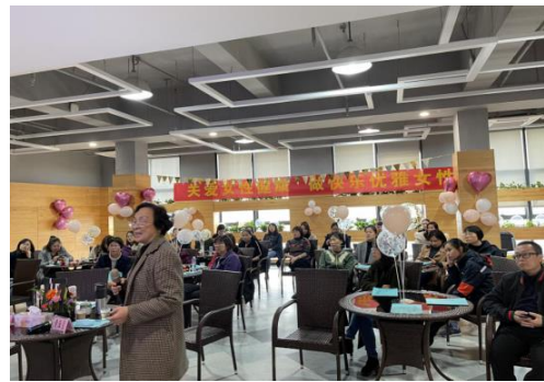
活动现场医师进行知识分享