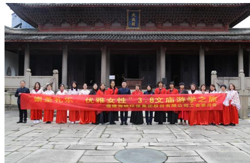
游文庙尚礼乐活动合照

报告期内，公司开展胃幽门螺杆菌检查活动，组织员工分批次进行检测，认真聆听医生的叮嘱，遵照医生的指示，并且为每一名空腹做检查的职工准备了丰富营养的爱心早餐，进一步增强了职工关注脾胃健康的意识，让大家充分了解科学保护脾胃健康的重要性；公司举办“三八国际妇女节”系列活动，创新主题活动形式，通过文庙游学涵养传统气质和女性生理卫生沙龙义诊，将职场女性身心健康关爱落到实处；公司食堂注重提升健康膳食品质，关注员工需求，推出特色面点窗口，每周定期为就餐职工提供多样性的面点选择，