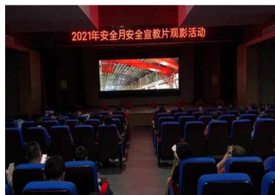
安全宣教片观影活动