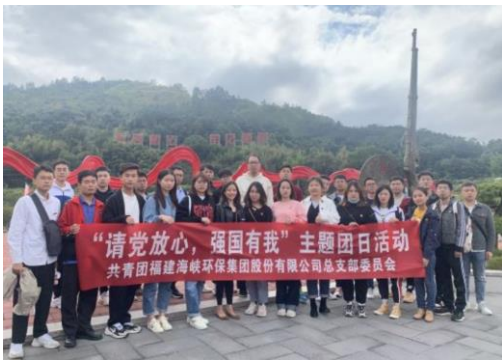
“请党放心，强国有我”主题活动

公司党委提出，要开展立志高远、形式活泼、富有成效的经常性党员教育活动和主题团日活动，主动团结群众中的积极分子，走进基层行项目，走进田间地头，到生产一线去，与体现正能量的各行各业先进标杆做共建、同进步。结合业务特别、党员情况，公司积极开展“请党放心，强国有我”、“参观文林山党性锤炼专题展”、“青春同心·永跟党走”、“粽情端午 学史增信”、组织观看红色电影《革命者》和《1921》等活动。