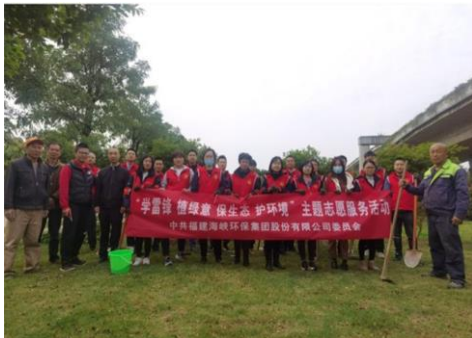
“学雷锋 护绿意”志愿者合影

联合石鼓社区党支部，组织党团员志愿者在六一佳园开展“浓情拗九节 温暖在榕城”活动，为社区老人送上一碗温暖的拗九粥，传承福州特有的拗九节民俗传统，传递满满的温暖与爱心。并向社区居民进行生活污水处理、垃圾分类等环保知识的志愿服务，活动现场气氛浓烈。