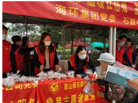
志愿者分发拗九粥