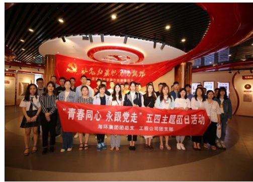
“青春同心·永跟党走”主题活动