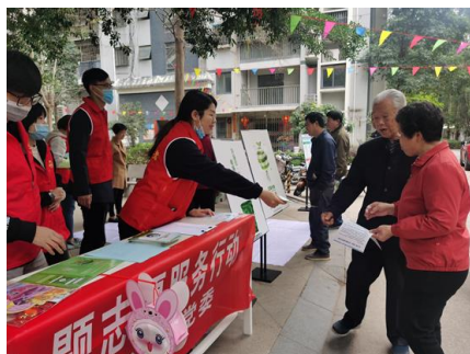
志愿者宣传垃圾分类知识

多年来，公司勇担企业社会责任，用各种方式回馈社会，关心弱势群体，积极投身于公益事业，树立了良好的社会形象，有效提高了企业的社会美誉度。公司始终坚持志愿者公益活动，积极号召公司党员、青年群众投身志愿者服务行列。报告期内，公司组织开展各种形式的志愿者活动：