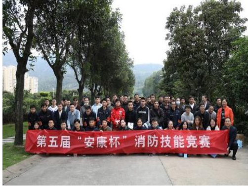
“安康杯”消防技能竞赛

报告期内，公司组织开展了73场应急演练，参演人数达1,131人次。主要涉及有限空间作业、化学品泄漏、防汛防台、消防安全、山体滑坡、电梯应急救援等不同场景和类型，进一步提升全员应急处置操作技能，演练后对应急预案进行评估、修订，确保预案的有效性和适用性。