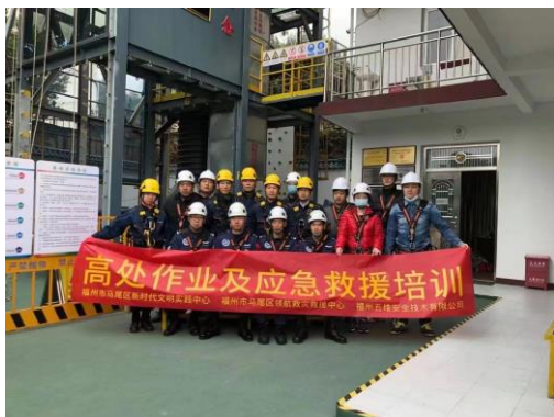
高空作业及应急救援培训

公司充分利用LED滚动屏、横幅、宣传海报、宣传展板、微信工作群、OA系统、观看安全宣教片等多种形式向员工普及安全知识，组织开展职业病宣传周、防灾减灾日、安全生产月、“控事故、保安全、迎建党百年”、“平安海环”等形式多样的专项宣教工作，覆盖集团及分子公司各级管理人员与基层员工，全面提高员工的安全意识。报告期内，公司共组织开展各类安全教育培训121场，培训人数达2,208人次，营造安全文化氛围，全面提升职工的安全意识。