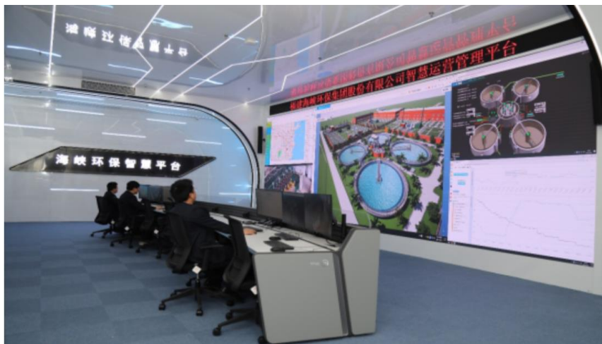
海峡环保智慧平台

公司着力推动传统环保行业与现代新技术的融合，组建江苏海峡环保科技发展有限公司，打造研发创新平台，培育新型智慧化环保服务产业。报告期内，由其承担开发的公司城镇污水处理智慧运营管理平台完成洋里、祥坂、浮村、永泰4家污水处理厂和红庙岭垃圾渗沥液处理厂的上线使用，并且实现了对洋里、祥坂、浮村3家污水处理厂的设备实时运行状态、仪表实施监测数据、视频监控实时画面的采集和传输。随着该平台在公司旗下污水处理厂的推广使用，公司逐步实现了对污水处理厂设备仪表运转状态、生产运营情况的实时远程掌控与管理，一方面可以提高污水处理厂运营管理效率，一方面可以强化对污水处理厂日常生产运营情况的监管，进而不断提高运管效率，确保稳定达标、节能降耗、安全生产的运营目标。