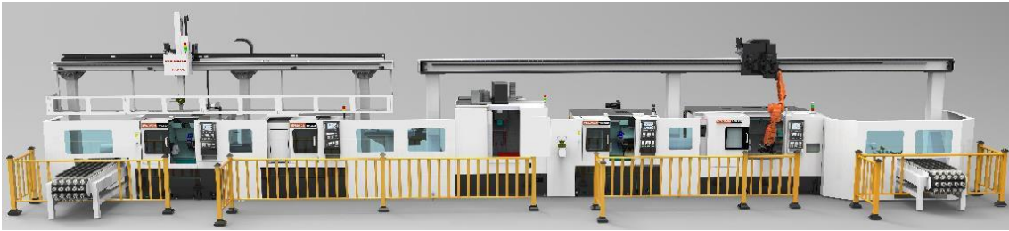
一体式自动化生产线