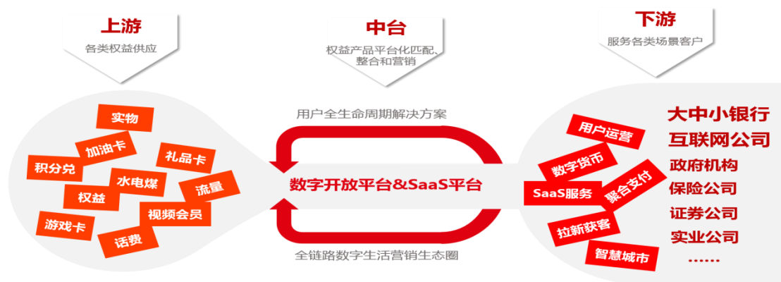
图一：数字生活营销业务基本模式

服务覆盖用户全生命周期，实现个人客户价值的深度挖掘和持续增长。公司累计合作伙伴超万家，涵盖金融、证券、保险、能源、运营商、互联网电商、传统零售等多个行业，公司与中国银联、中国工商银行、平安银行等多家大型金融机构达成战略合作，同时也是腾讯车生活、微信支付、浦发银行、工行工银e生活的优质服务商，在泛金融领域长期居于头部服务商地位，并且保持强劲的业务增长势头。