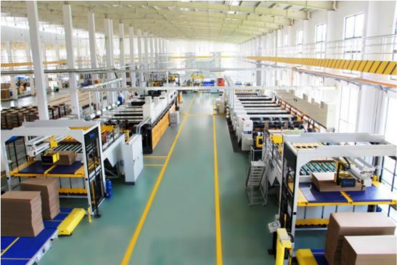
(子公司奉其奉绿色环保印刷包装智慧工厂生产线)

程和现场管理，减少了人力、场地等要素消耗。目前公司与智能生产线相关的发明专利和软件著作权等超过10项。