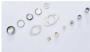
○ 门锁、座椅、安全系统 Latches, Seating & Safety Beld System