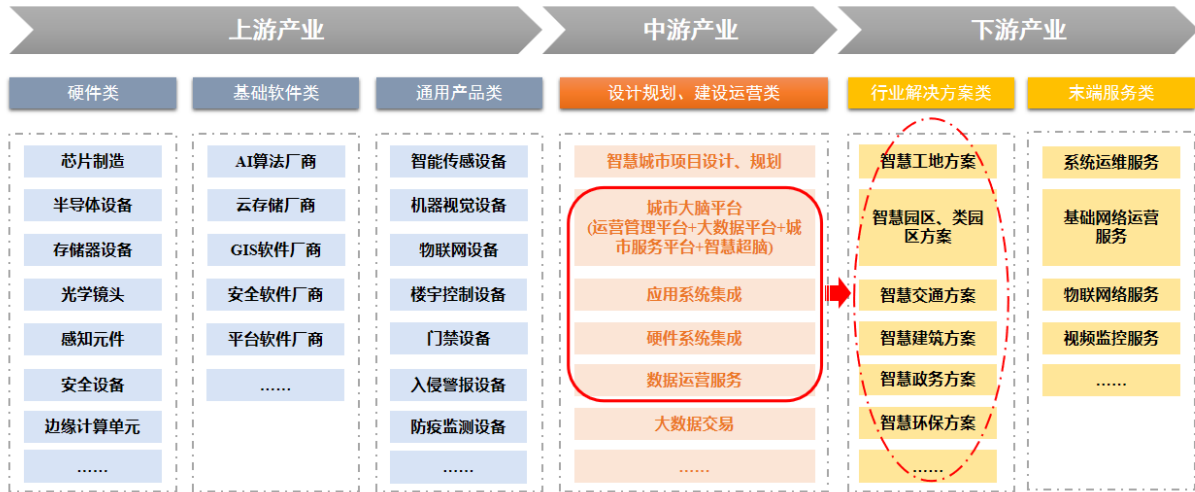
图注：倍智能的定位居于产业链中游红色框线部分和下游椭圆虚线部分，且下游产业中解决方案所需能力由中游框线部分提供。