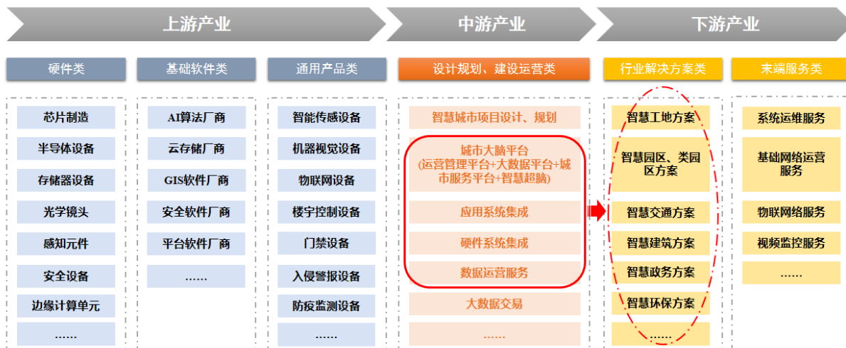
图注：倍智智能的定位居于产业链中游红色框线部分和下游椭圆虚线部分，且下游产业中解决方案所需能力由中游框线部分提供。