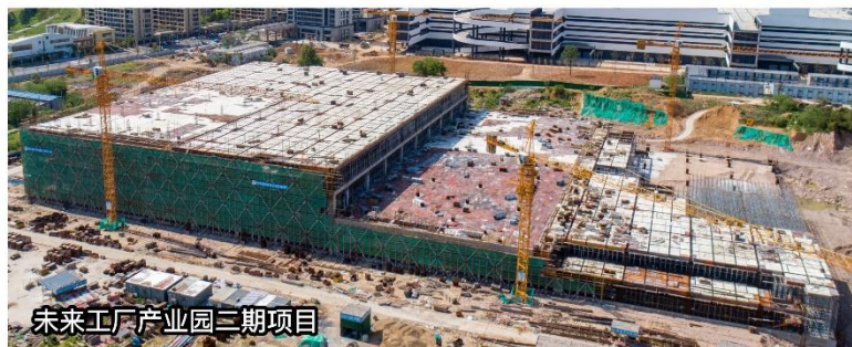
未来工厂产业园二期项目