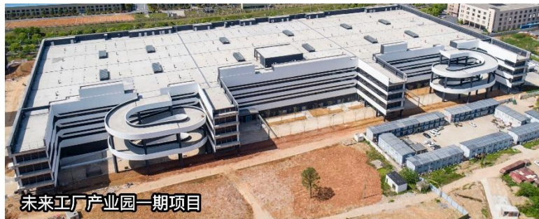
未来工厂产业园一期项目