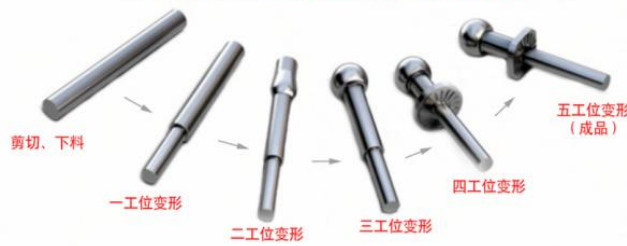
原材料进入冷成形装备后的变形加工过程