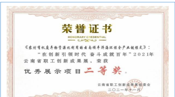
2021年11月，公司“农村有机废弃物资源化利用的云南顺丰洱海环保全产业链模式”荣获云南省职工创新成果展荣获优秀展示项目二等奖。