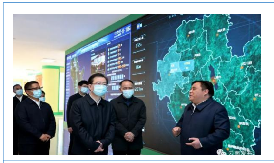
2021年12月，省委书记王宁调研公司生产经营情况，对废弃物资源化综合利用“顺丰洱海模式”予以了高度的肯定。