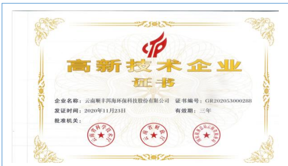
2021年1月，公司再次被认定为“国家级高新技术企业”。