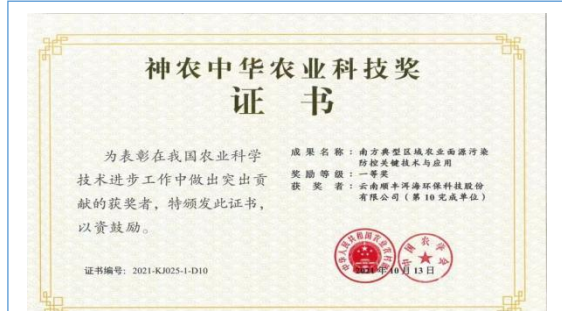
2021年10月，公司“南方典型区域农业面源污染防治关键技术与运用”成果荣获国家农业农村部和中国农学会颁布的“神农中华农业科技奖”一等奖。