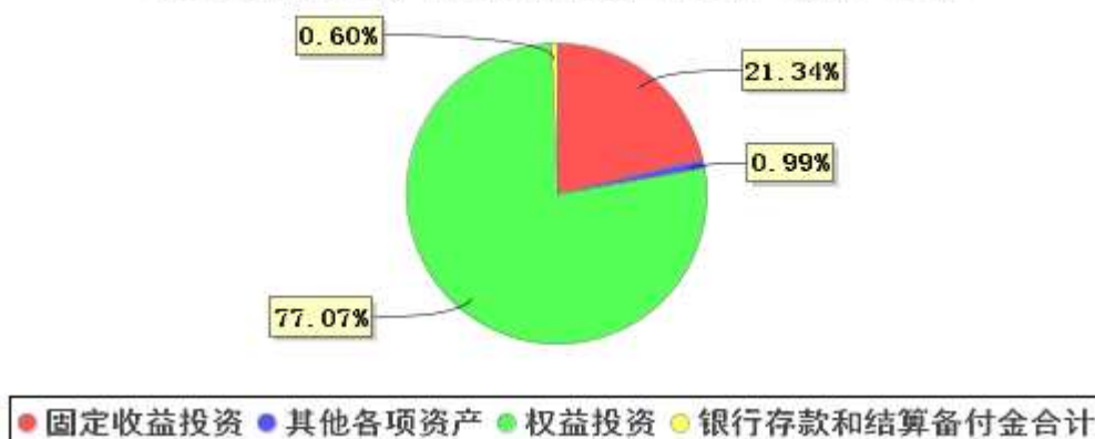
投资组合资产配置图表(2022年3月31日)