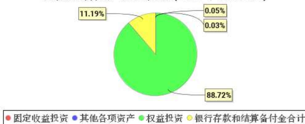
投资组合资产配置图表(2021年3月31日)