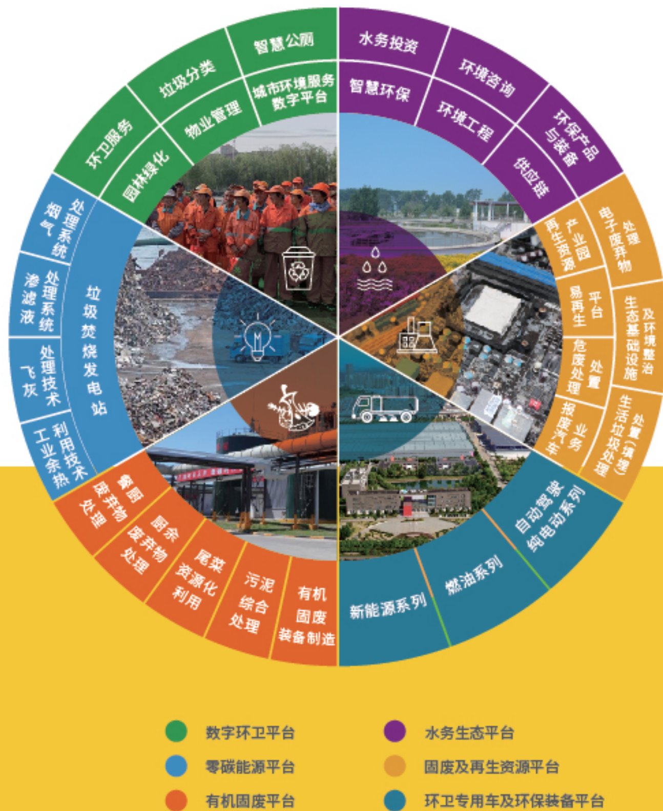
图例1:公司业务结构图

本报告期内公司旗下共有参控股企业超过300家，业务内容涵盖了零碳能源平台、固废与再生资源平台、有机固废平台、水务生态平台、数字环卫平台、环卫专用车及环保装备平台六大板块，其中包括启迪数字环卫(合肥)集团有限公司、启迪再生资源科技发展有限公司、浙江启迪生态科技有限公司、雄安浦华水务科技有限公司、北京启迪零碳科技有限公司、合加新能源汽车有限公司等重点子公司。公司集投资、研发、咨询、设计、建设、运营、系统集成、设备制造、互联网平台、绿色金融等于一体，拥有环境全产业链的规模布局，打造城市环境服务管家，为客户提供综合全生命周期一体化服务。