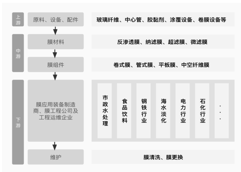
上下游产业链示意图

公司主要产品为膜产品，上游产业链主要是制膜所需的化学原料、仪器仪表、涂膜设备、卷膜设备等原料、设备和配件制造行业，上游原料和设备的品质对中游膜产品性能具有显著影响，上游行业产品价格受市场供求和全球经济运行情况影响较大，其价格波动对公司的生产成本产生一定程度的影响。下游产业链主要是膜应用装备制造、膜工程公司以及工程运维企业。膜材料和膜组件作为膜法水处理的核心部件，是决定下游工程产水水质的关键因素，下游行业的膜分离应用需求与国家政策及行业标准息息相关，同时，国民经济运行状况、人民生活消费水平、健康饮水意识密切影响着下游行业景气度，对膜产品的发展具有重要的牵引和驱动作用，直接影响着中游膜产品及服务的需求、性能和价格变化。