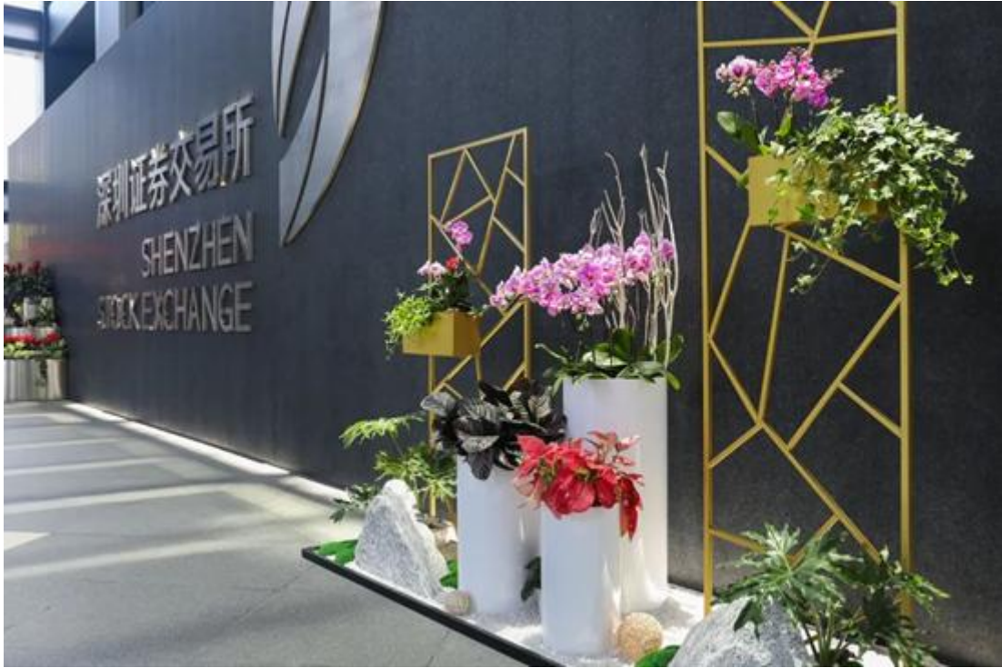
深圳证券交易所室内绿植租摆项目

在报告期内公司董事会和管理层通过分析宏观经济形势、行业发展趋势及公司自身情况，与时俱进调整发展方针，收缩风险较大的业务，秉承“稳健和可持续经营”的投资发展模式，以“大平台建设战略”为核心，以创新和人才为两大驱动，以考核激励、系统管理和服务支撑三大体系为支柱。同时，公司扎根广东并深耕粤港澳大湾区，面向全国市场重点开拓经济实力强、发展程度高的区域，有策略地选择战略城市布局，努力提升公司的市场话语权。