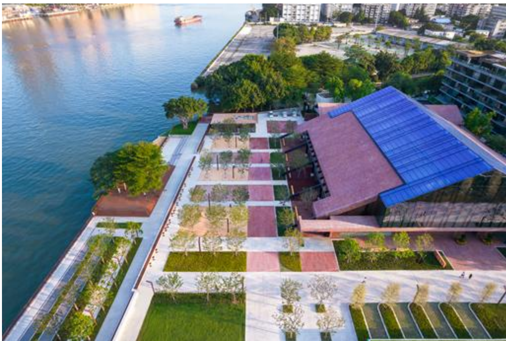
广州白鹅潭聚龙湾展示中心及珠江碧道设计项目