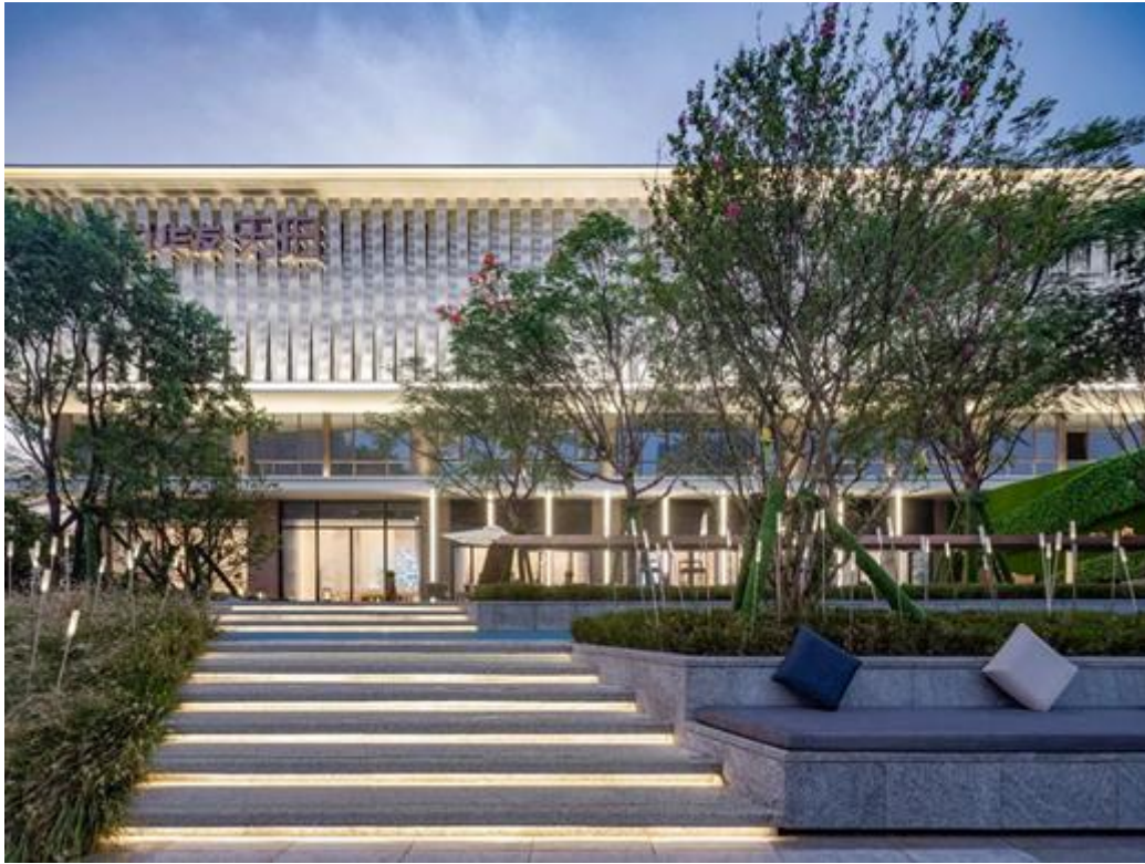
广州市南沙区天珀雅苑项目展示区园林景观工程

融资服务-工程建设-招商运营”等五位一体的商业模式，创造无限生机。公司在园林绿化行业具有一定的市场地位和品牌知名度，业务范围覆盖粤港澳大湾区、长三角、黄河流域、成渝城市群、长江中游城市、国家级新区等重点区域。报告期内，园林景观类营业收入比上年同期上升9.80%，园林景观板块毛利率8.33%，较去年同期上升0.67%。