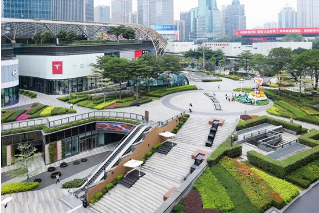
广州天环广场商业园区绿化养护项目

微改造、时花布置等方面提供全方位的城市运营服务。同时，公司结合当前先进的人工智能、物联网技术、云服务技术、空间地理信息技术和移动应用技术等，积极研究发展“物联网+智能垃圾分类回收”系统解决方案，为城市运营领域智慧化、信息化提供高效管理和数据支撑服务。普邦股份精品理念贯穿到业务运营中，建立统一技术标准体系，提升统一队伍服务质量，以专业化、多元化、精细化的服务，推动城市功能和结构健康均衡发展，提升城市品质和内涵，助力城市形象建设，焕新城市美好生活。