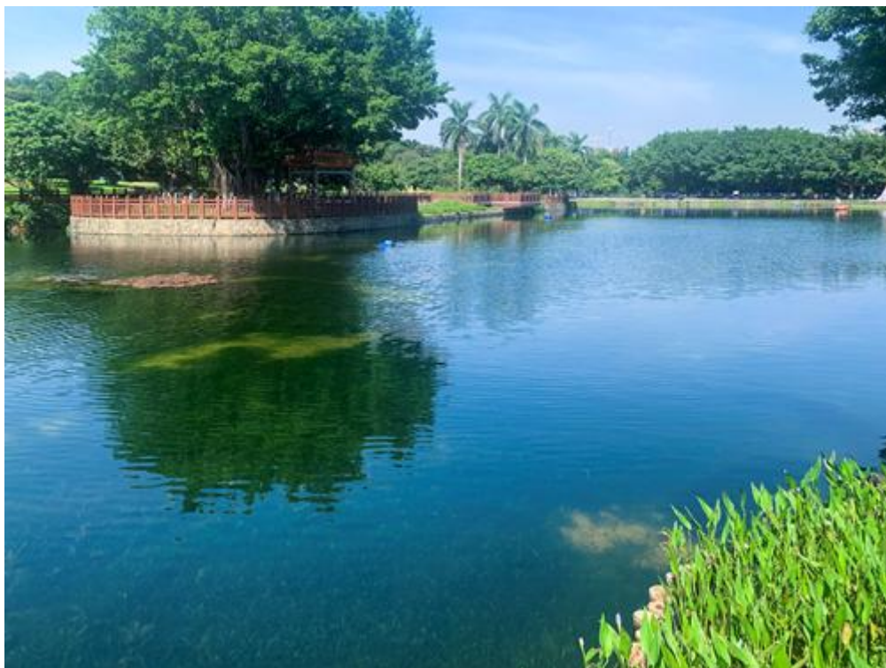
广州丹水坑风景区景观提质与水系整治工程

公司秉持“人水和谐、人水共荣”的价值观，遵循水环境治理与景观设计相结合的路径，强调生态性、科学性与舒适性并重的治理理念。公司把在景观营造的优势向水环境治理领域延伸，以生态设计为先导，技术研发为依托，运用“景观--水治理--智慧城市”协同整合解决方法，努力将水环境治理业务发展涵盖到咨询、规划设计、施工及运营等领域的完整产业链，创造人与自然和谐之美。