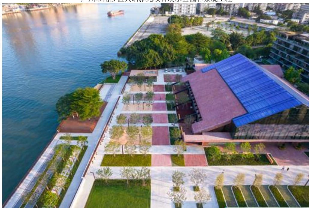
广州白鹅潭聚龙湾展示中心及珠江碧道设计项目