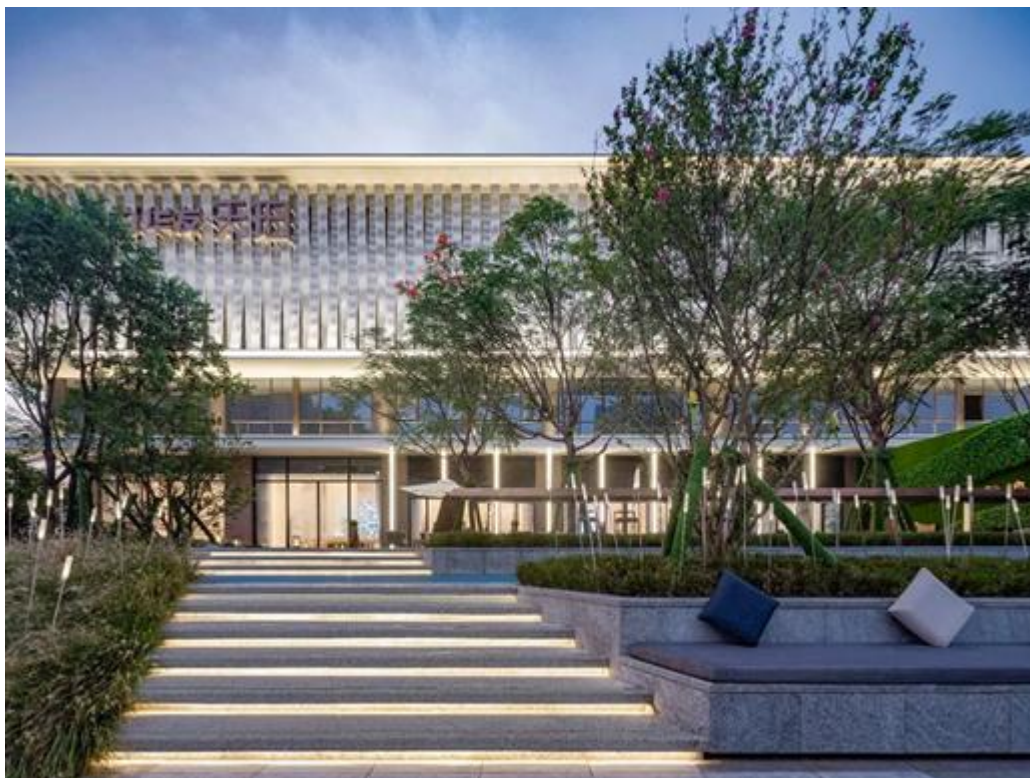
广州市南沙区天珀雅苑项目展示区园林景观工程