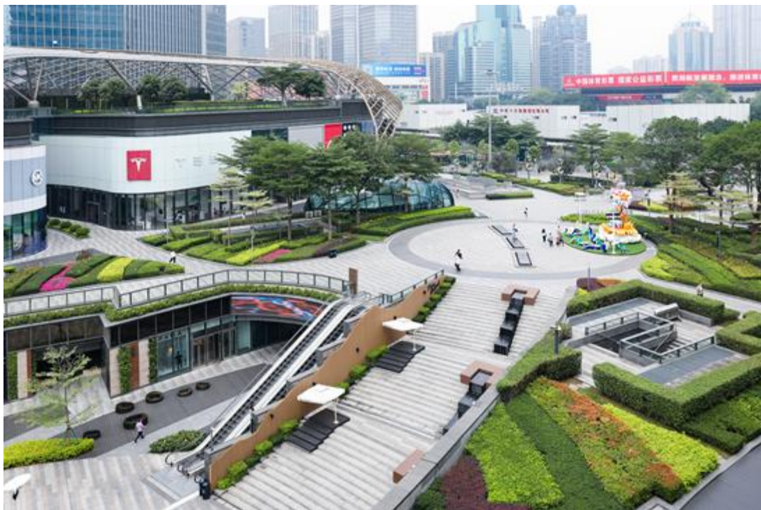
广州天环广场商业园区绿化养护项目