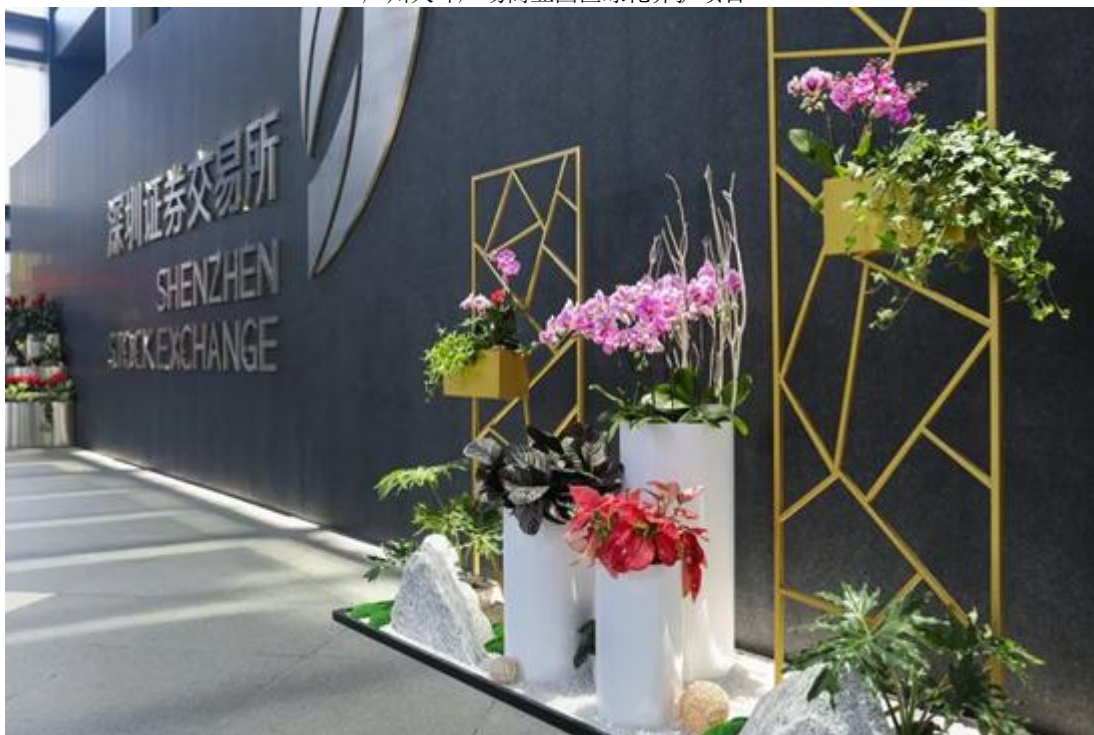
深圳证券交易所室内绿植租摆项目

在报告期内公司董事会和管理层通过分析宏观经济形势、行业发展趋势及公司自身情况，与时俱进调整发展方针，收缩风险较大的业务，秉承“稳健和可持续经营”的投资发展模式，以“大平台建设战略”为核心，以创新和人才为两大驱动，以考核激励、系统管理和服务支撑三大体系为支柱。同时，公司扎根广东并深耕粤港澳大湾区，面向全国市场重点开拓经济实力强、发展程度高的区域，有策略地选择战略城市布局，努力提升公司的市场话语权。