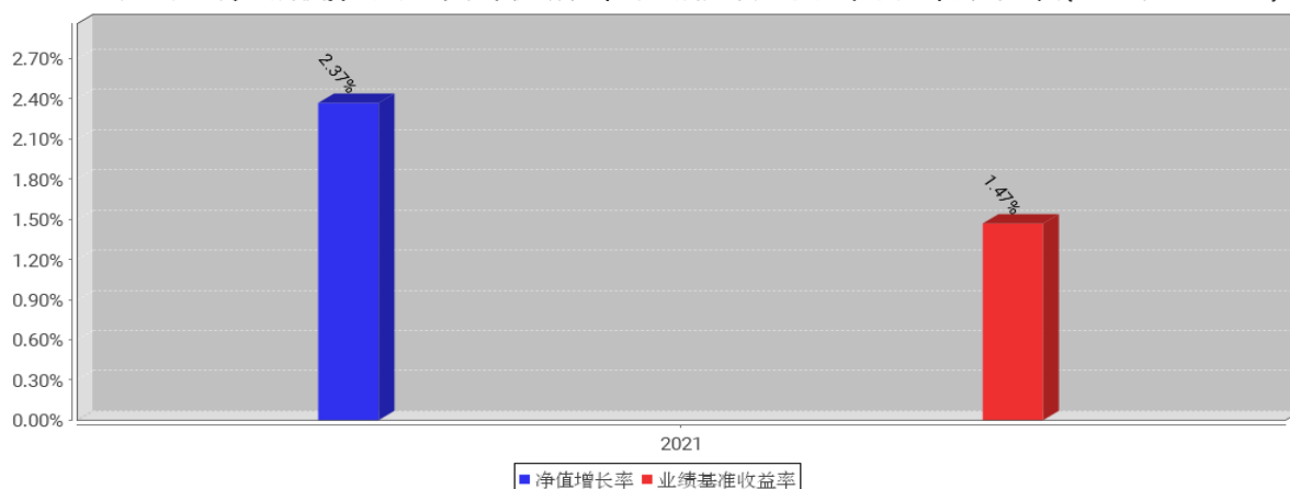
工银双玺6个月持有期债券A基金每年净值增长率与同期业绩比较基准收益率的对比图(2021年12月31日)

注:1、本基金基金合同于2021年6月11日生效。合同生效当年不满完整自然年度的,按实际期限计算净值增长率。