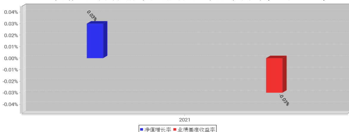
工银聚丰混合C基金每年净值增长率与同期业绩比较基准收益率的对比图(2021年12月31日)

注:1、本基金基金合同于2021年5月28日生效。合同生效当年不满完整自然年度的,按实际期限计算净值增长率。