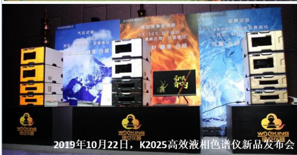
2019年10月22日，K2025高效液相色谱仪新品发布会