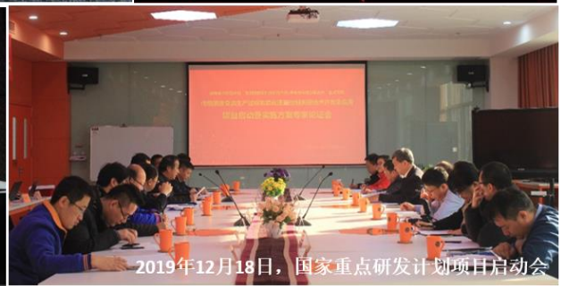
2019年12月18日，国家重点研发计划项目启动会