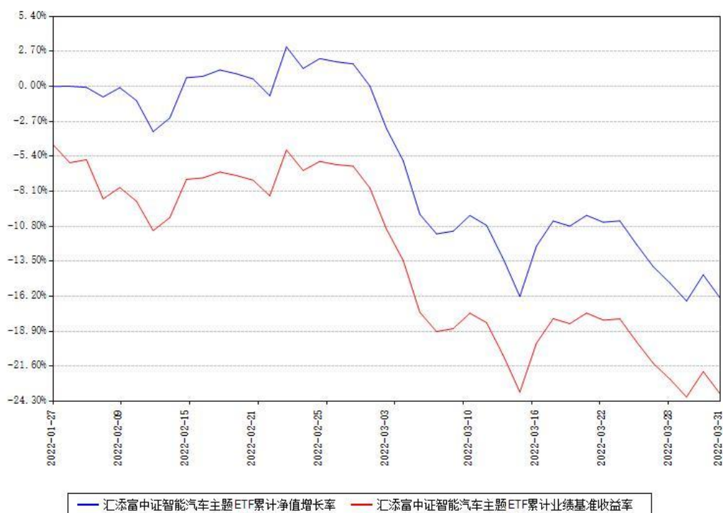
汇添富中证智能汽车主题ETF累计净值增长率与同期业绩基准收益率对比图

(二) 自基金合同生效以来基金累计净值增长率变动及其与同期业绩比较基准收益率变动的比较