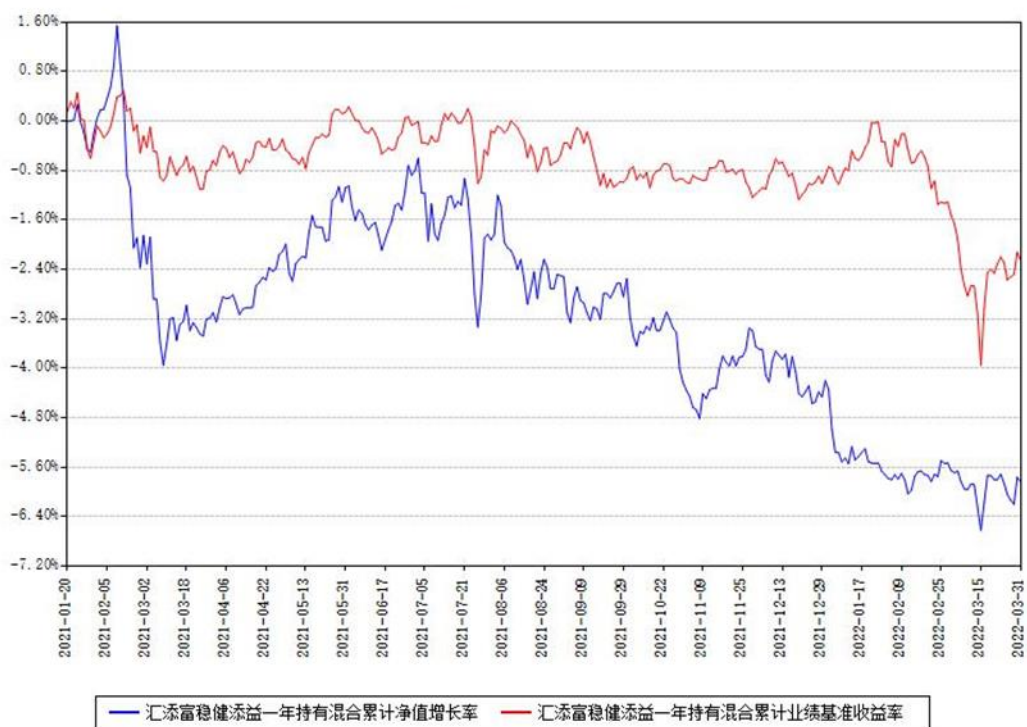
汇添富稳健添益一年持有混合累计净值增长率与同期业绩基准收益率对比图