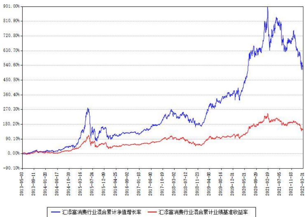
汇添富消费行业混合累计净值增长率与同期业绩基准收益率对比图