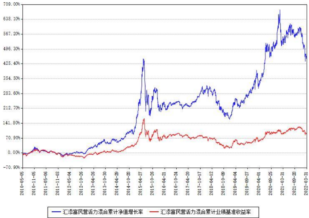
汇添富民营活力混合累计净值增长率与同期业绩基准收益率对比图