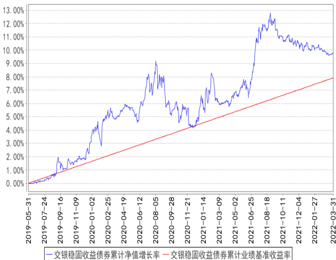
交银稳固收益债券累计净值增长率与同期业绩比较基准收益率的历史走势对比图

注：本基金由交银施罗德荣祥保本混合型证券投资基金转型而来。基金转型日为2019年5月31日。本基金的投资转型期为交银施罗德荣祥保本混合型证券投资基金保本周期到期选择期截止日次日（即2019年5月31日）起的3个月。截至投资转型期结束，本基金各项资产配置比例符合基金合同及招募说明书有关投资比例的约定。