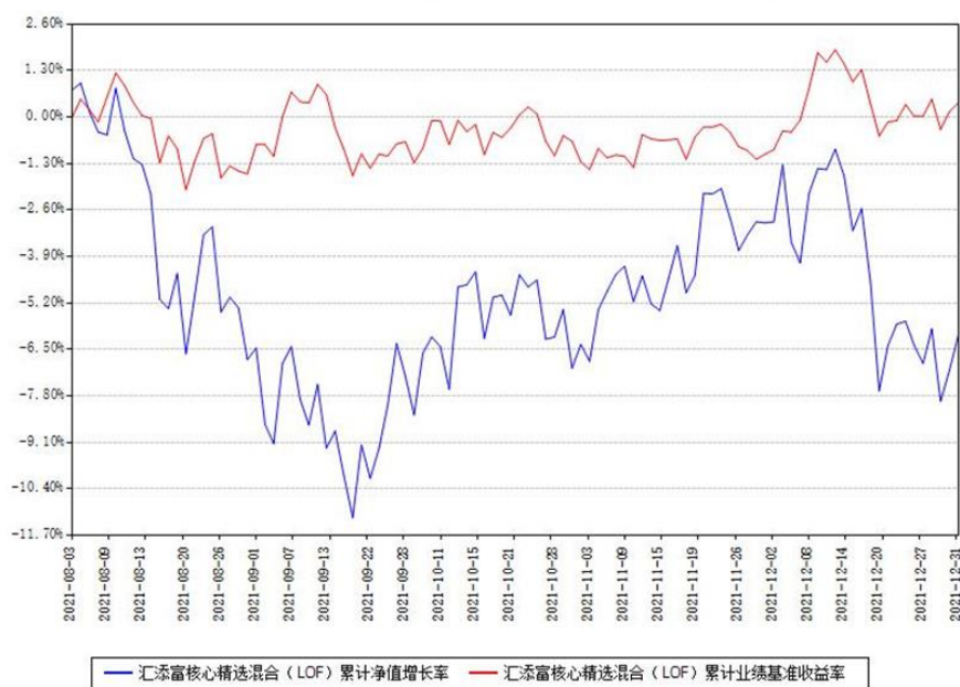
汇添富核心精选混合（LOF）累计净值增长率与同期业绩基准收益率对比图

（二）自基金合同生效以来基金累计净值增长率变动及其与同期业绩比较基准收益率变动的比较图