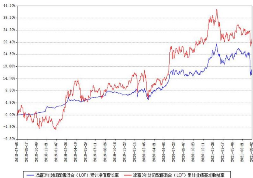
添富3年封闭配售混合（LOF）累计净值增长率与同期业绩基准收益率对比图

（二）自基金合同生效以来基金累计净值增长率变动及其与同期业绩比较基准收益率变动的比较图