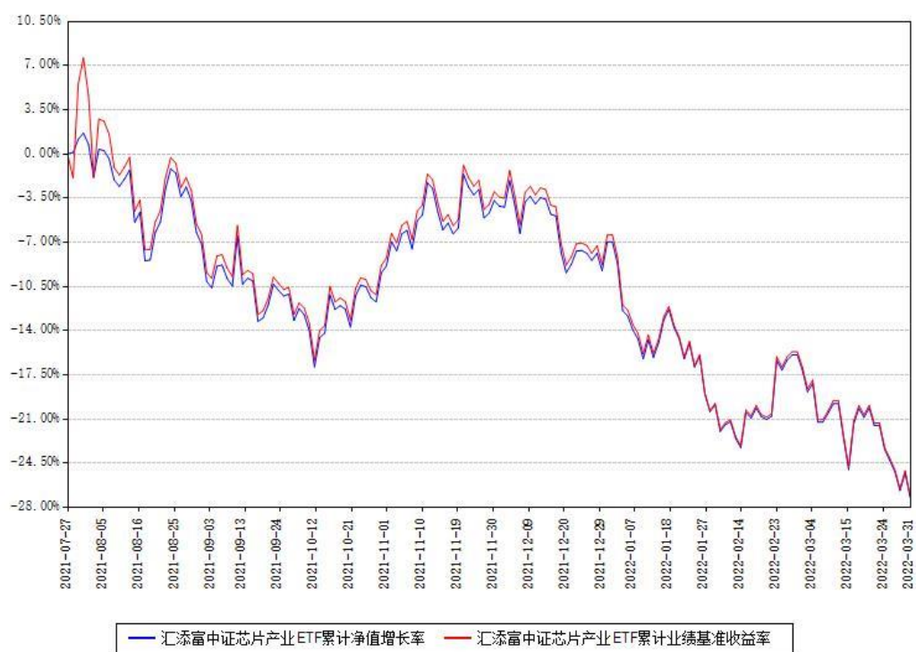
汇添富中证芯片产业ETF累计净值增长率与同期业绩基准收益率对比图