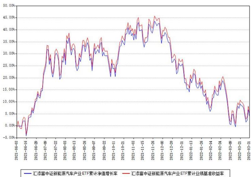
汇添富中证新能源汽车产业ETF累计净值增长率与同期业绩基准收益率对比图