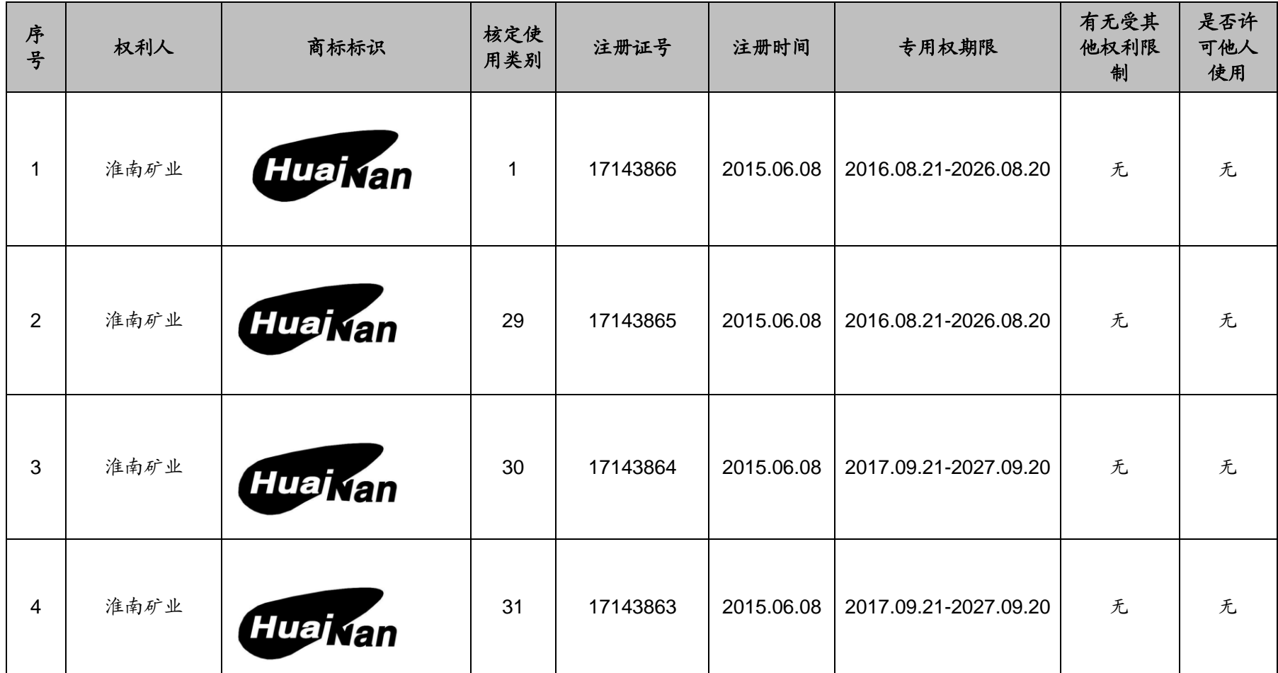
附表五：淮南矿业及其下属子公司的商标